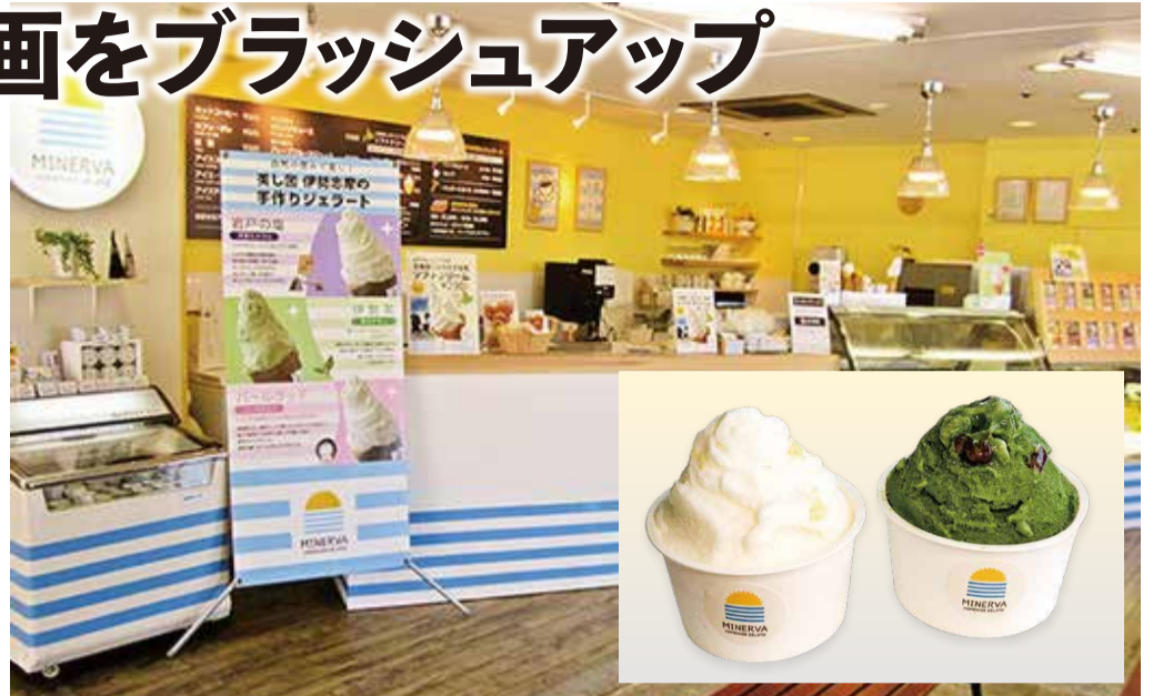
左は、この夏新発売「マイヤーレモンヨーグルト」、右は「抹茶ソルベ小豆」

また、国の支援制度も活用して自社での製造・販売体制を確立されて、自社製造のジェラートの提供が可能となり、季節に合わせて展開する多彩な新メニューがお客さまに好評を得ています。また、OEMによるジェラートのご提供もご要望にお応えして対応されることになりました。